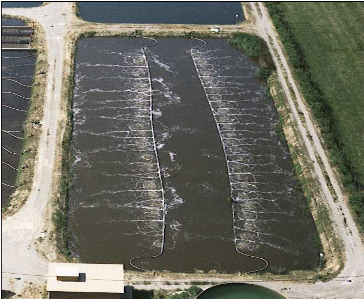
Vista aèria de la segona llacuna de la depuradora de Cervera

La segona llacuna és rectangular de mides aproximades 92m x 32m.